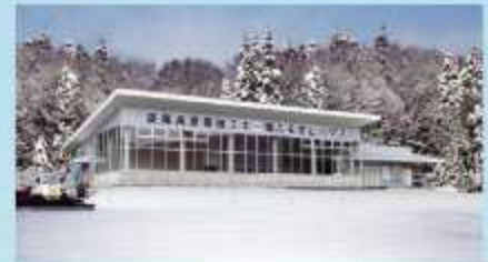
レストハウスふるさと